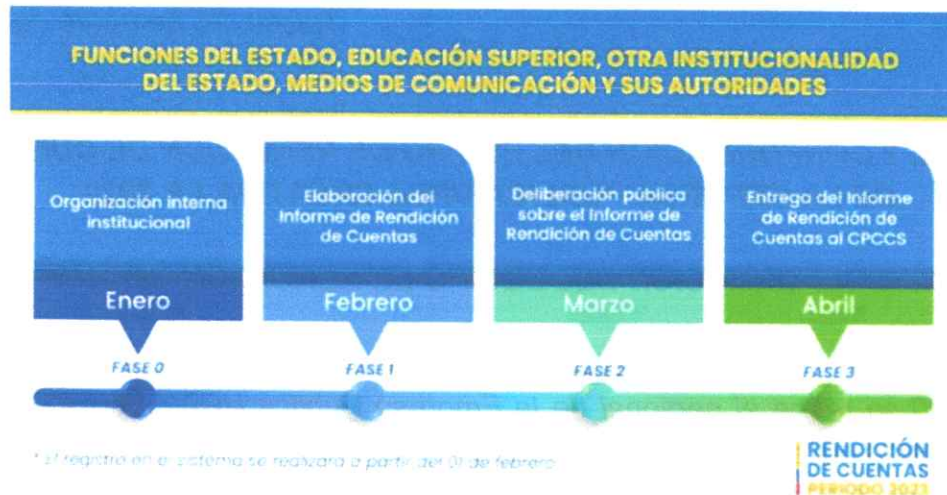
Ilustración 1: Cronograma de rendición de cuentas 2023

Siguiendo con el orden del día se procede a la conformación del equipo de trabajo para el evento mencionado anteriormente, para lo cual el Sr. Gerente General designa de la siguiente manera el equipo de rendición de cuentas 2023: